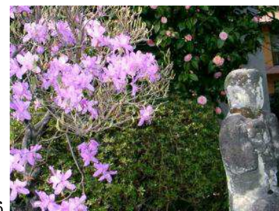
▲トウゴクミツバツジ

▲ひどい腐れ 瓦をどかすと、正面屋根と西屋根の「野隅」が驚くほど腐っている。現場を見た役員が「いまやってよかった」とつぶやいていました。