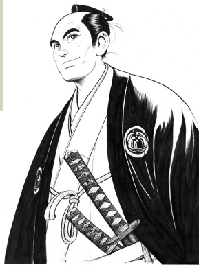
記念館のシンボル画像 ▲木村直巳画

日本産業革命の地横須賀造船所を建設。「日本海戦で勝利し、日本がロシアの属国にならなかったのは小栗さんのおかげ」と東郷平八郎が感謝/日本近代化の父の業績を伝える記念館です。