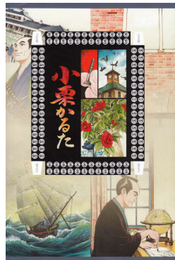
▲ブック版「小栗かるた」

◆価格 子供向けの特別価格としました 『かるた』1400円/『ブック版』1100円