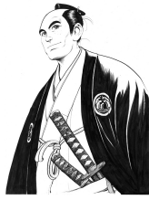
記念館のシンボル画像▲ 木村直巳画

日本産業革命の地横須賀造船所を建設・「日本海戦で勝利し、日本がロシアの属国にならなかったのは小栗さんのおかげ」と東郷平八郎が感謝/日本近代化の父の業績を伝える記念館です。