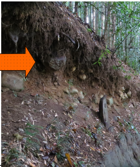
矢印・参道に大きな石が落ちそう。

西の石垣改修、石段のいたみが激しく、また大きな石が抜け落ちそうな参道の改修工事等を予定しており、本堂の須弥壇の真上が雨漏りしたあとの天井・床の張替え工事など、追加工事が発生しております。 △「住職は一代、寺は末代」という言葉通り、過疎化が進む中であんなにか今のうちにやるべきことを実行して、せめて百年後まで安心してお参りできる東善寺にしておきたい工事です。 ご寄付を継続中の皆様には、今後とも引き続きご協力をお願い申し上げます。